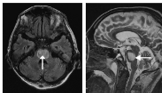
Figure 1: Myélinolyse centropontine.

besoins métaboliques. La myélinolyse centropontine se présente par un polymorphisme cliniques et peut même rester silencieuse, de découverte fortuite lors de la réalisation d'une imagerie cérébrale. Il n'y a pas de traitement spécifique, même si certains ont récemment montré chez l'animal [12] mais aussi en pathologie humaine [13, 14] que la réinduction de l'hyponatrémie peut permettre une récupération neurologique. Même si ce syndrome n'est pas irréversible, il est grevé d'une morbidité particulièrement lourde. Une étude récente portant sur 34 patients ne révèle que deux décès, les autres ayant récupéré pour un tiers ad integrum [15].