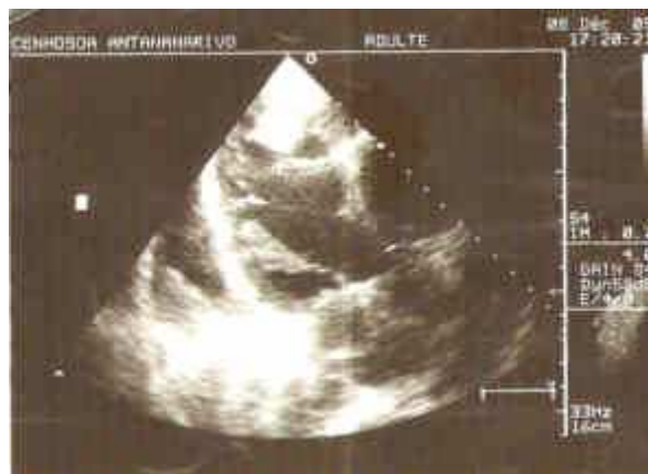
Figure 1: Dilatation biventriculaire, thrombus intramural de 9 mm de diamètre à la pointe du VG

La cardiomyopathie du péripartum a plusieurs formes cliniques, dont un tableau d'insuffisance cardiaque congestive ou ses nombreuses complications vasculaires [5] chez un patient sans antécédent cardiovasculaire. Par conséquent, son diagnostic peut être difficile et l'élimination des autres causes d'insuffisance cardiaque congestive est essentielle [6, 14]. Elle peut être découverte devant un tableau de thrombose intra cardiaque, d'une ischémie aiguë du membre inférieur par embolisation [15] ou d'une embolisation pulmonaire [16]. Concernant notre cas, la décompensation respiratoire aiguë constituait le signe d'appel et l'échocardiographie bidimensionnelle a objectivé une cardiomyopathie dilatée avec dysfonction ventriculaire gauche (fraction d'éjection systolique à 40 %) compliquée d'un thrombus intra mural de la cavité ventriculaire gauche. Aucune anomalie murale, signalée par certains auteurs [17]. Selon la littérature, la décompensation respiratoire en cas de cardiomyopathie du péripartum semble être associée à une hypokinésie ventriculaire globale responsable d'un effondrement de la fraction d'éjection systolique [14]. Devant ce tableau clinico-